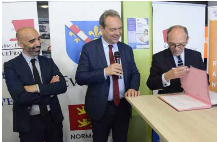
Signature de la convention de partenariat

Faciliter vos démarches administratives auprès des principaux services publics (Caisse d'Allocations Familiales, Caisse Primaire d'Assurance Maladie). D'autres partenaires y sont aussi présents pour vous accompagner (Centre Communal d'Action Sociale, Mission Locale, Maison de la Justice et du Droit, Planning Familial, écrivain public, droit des étrangers, service habitat jeunes ...).