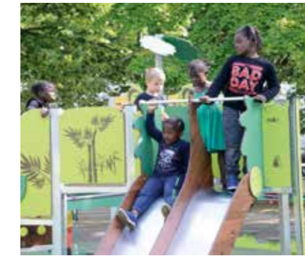
Le nouveau square a été inauguré le 23 mai 2019

D'autres installations sont à votre disposition comme les équipements sportifs de plein air situés square Kennedy et sur l'axe vert pour pratiquer des exercices de remise en forme et de musculation.