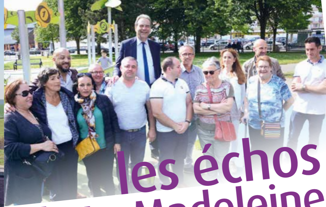
Photo souvenir lors d'une sortie culturelle au site archéologique de Gisacum, organisée par le centre social.

Belle mobilisation du centre social pour un été très animé !