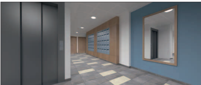
Le hall d'entrée totalement rénové