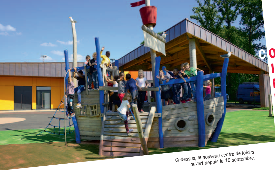
Ci-dessus, le nouveau centre de loisirs ouvert depuis le 10 septembre.