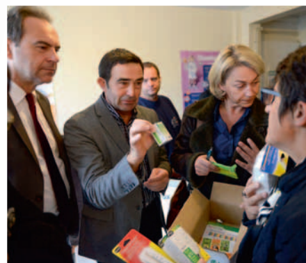
Remise d'un "kit énergie" aux élus lors de l'inauguration de l'appartement pédagogique.

Retrouvez tous les détails de l'opération sur ce flyer "Info'Logis"